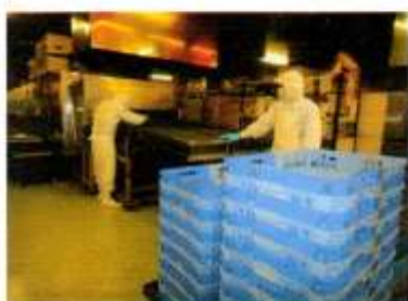
焼きあがって出てくる所。

これを長さ15mあるオープンで170度40分かけて焼き常温室でゆっくりと扇風機で冷まし切り分けます