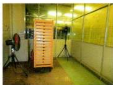
冷ましている部屋

これを長さ15mあるオープンで170度40分かけて焼き常温室でゆっくりと扇風機で冷まし切り分けます